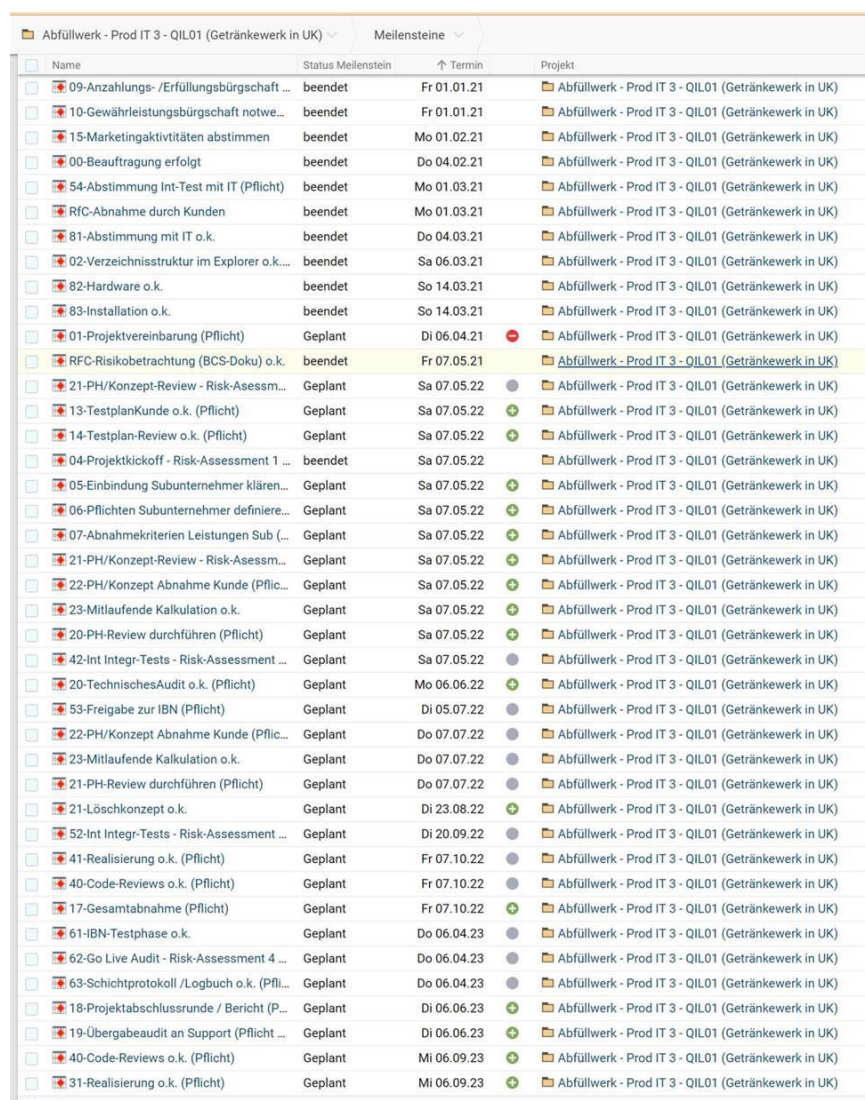
Projektplanung mit Projektron BCS bei der SALT Solutions GmbH

Diese Verflechtung von Qualitätsmanagement und Projektab-