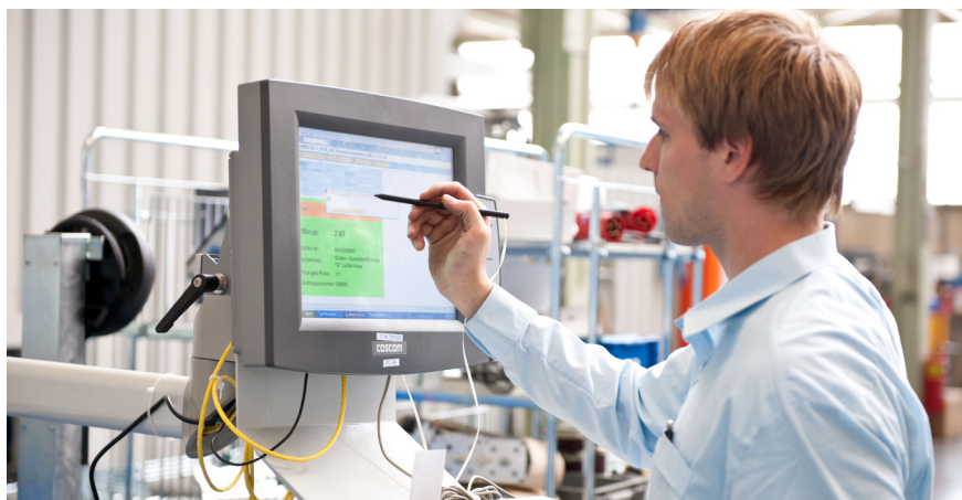
SALT Solutions Implementierung bei der Firma Cloos Schweißtechnik

In solchen Projekten ist die Abstimmung von Qualitäts- und Projektmanagement aufeinander entscheidend. Nur so können wir unsere Lösungen bei laufendem Betrieb und unter hohem Zeitdruck einführen. Für diesen reibungslosen Ablauf im Projektmanagement setzen wir Projektron BCS seit 2004 ein.