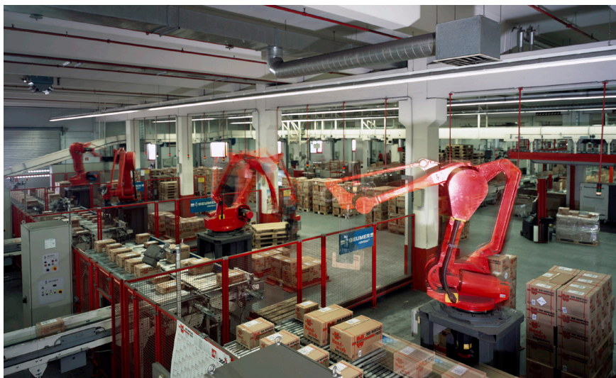
Würth GmbH & Co. KG

Auch mit dem integrierten Ticket-system unterstützt uns Projektron BCS. So kann unser mehr als 100 Personen starkes, SAP-zertifiziertes Supportteam viele kleinere Projekte zur Systempflege und Weiterentwicklung von SAP- und Fremdsystemen international und rund um die Uhr bearbeiten.